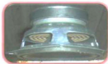
Gambar 3: Speaker