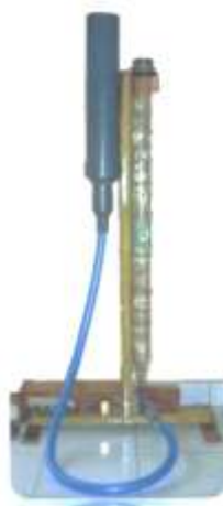
Gambar 8: set tabung resonansi