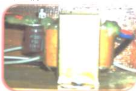
Gambar 4: Trafo