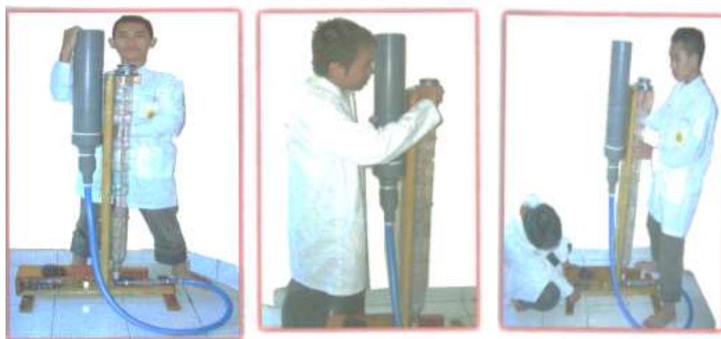
Gambar 10. Kegiatan pengecekan alat tabung resonansi