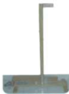
Gambar 6: Statif dari kayu

Membuat statif dari kayu seperti di gambar 6 berikut ini.