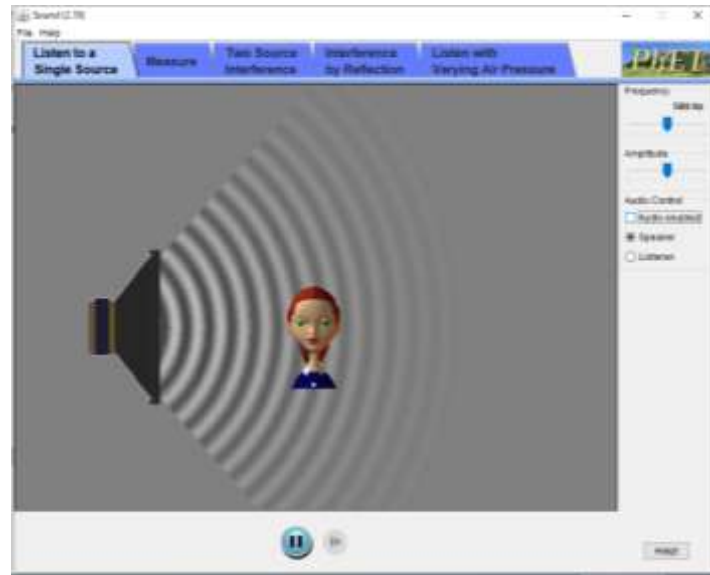
Gambar 9. Software PhET materi sound_all.jar

Hasil dari pelatihan dan penggunaan alat ini diharapkan dapat meningkatkan minat dan motivasi siswa dalam proses pembelajaran. Fenomena fisika dan konsep-konsepnya yang terkait dengan simulasi serta terkait dengan aplikasi keseharian siswa dapat menambah pengetahuan siswa secara visual dan menstimulus lebih banyak siswa untuk mencapai tingkat penguasaan yang tinggi mengenai konsep ilmu fisika (Tuysuz, 2010).