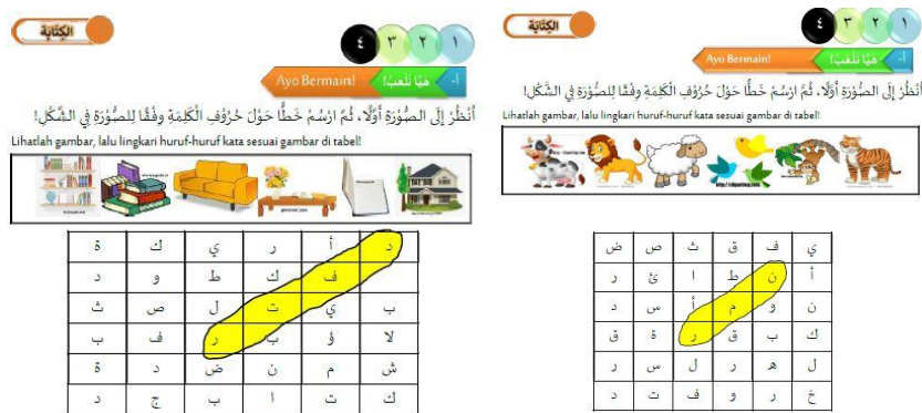
Gambar 2. Contoh Soal Word Square Visual

Kegiatan pembelajaran ini dapat menjadi penguat dan pendorong bagi siswa terhadap materi yang diberikan. Siswa diberi kesempatan melatih ketepatan dan ketelitian dalam menjawab dan mencari jawaban dalam lembar kerja. Dan yang paling ditekankan pada model pembelajaran ini ialah untuk berpikir efektif, dan menyajikan jawaban apa yang paling sesuai (Laosrirattanachai & Piyapong, 2021). Kegiatan ini menampilkan guru yang membagikan lembar kegiatan sesuai dengan arahan yang ada. Kemudian siswa mengarsir huruf dalam kotak sesuai dengan jawaban secara vertikal, horisontal maupun diagonal . Tidak hanya mengarsir, siswa bisa menarik garis terhadap huruf-huruf yang mengandung unsur kalimat ( mufrodat ) bermakna.