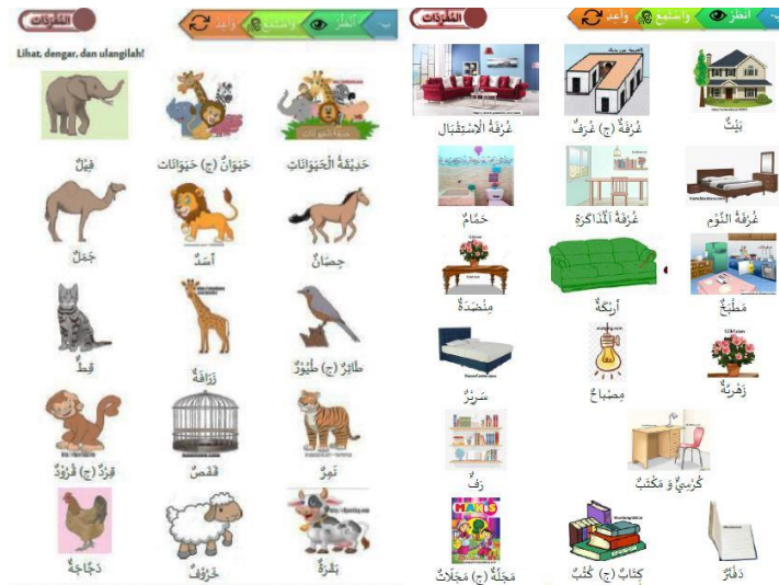
Gambar 1. Berbagai Mufrodat Hewan dan Peralatan Ruang Tamu/Belajar

Dari gambar teks / mufrodat di atas memperlihatkan bahwa materi siswa kelas V MI sesuai kebijakan Kementerian Agama pada semester ganjil, pembelajaran bahasa arab siswa mengkaji mengenai anggota tubuh, profesi, dan kebun binatang. Sedangkan pembelajaran bahasa arab pada semester genap mengkaji tentang peralatan di ruang tamu dan ruang belajar, laboratorium dan perpustakaan, serta kantin. Proses pembelajaran dengan model pembelajaran demikian mendorong pemahaman siswa terhadap materi pembelajaran. Siswa akan terlatih untuk disiplin dalam memperhatikan setiap ucapan seorang guru.