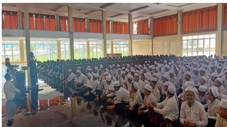
Gambar 1. Sosialisasi Covid-19 dari Dinas Kesehatan Setempat

Selanjutnya, dalam minggu pertama pembelajaran online, para guru mata pelajaran memberikan edukasi lebih lanjut mengenai wabah Covid-19 secara online melalui media seperti zoom, dan group WhatsApp. Materi ini mencakup penyebaran virus, informasi kasus terkini serta cara untuk memutus mata rantai Covid-19.