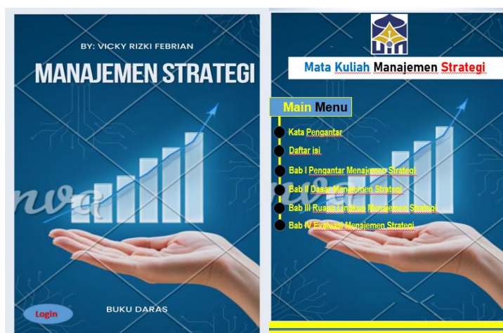
Gambar 2. Tampilan awal dan Menu Daftar isi E-Book

Pada tahap pertama dilakukan tahap pendefinisian ( define ) yaitu bahan ajar berbentuk E-Book yang dikembangkan harus sesuai RPS yang syah pada mata kuliah manajemen strategi. Semua materi yang ditetapkan dalam RPS dimuat ke dalam bahan ajar yang dikembangkan. Tahap berikutnya adalah tahap perancangan ( design ). Ditahap perancangan ini peneliti merancang dan menyusun outline serta prototype mengenai bahan ajar yang berbentuk E-Book. Tahap berikutnya peneliti menyusun draft bahan ajar yang berbentuk E-Book mata kuliah manajemen strategi dengan menggunakan aplikasi di komputer. Berikut hasil tampilan awal bahan ajar yang berbentuk E-Book.