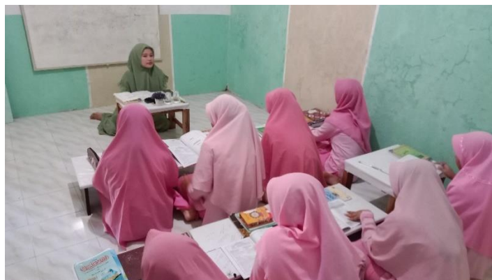
Gambar 1 Proses Pembelajaran Kitab Kuning Metode Amsilati