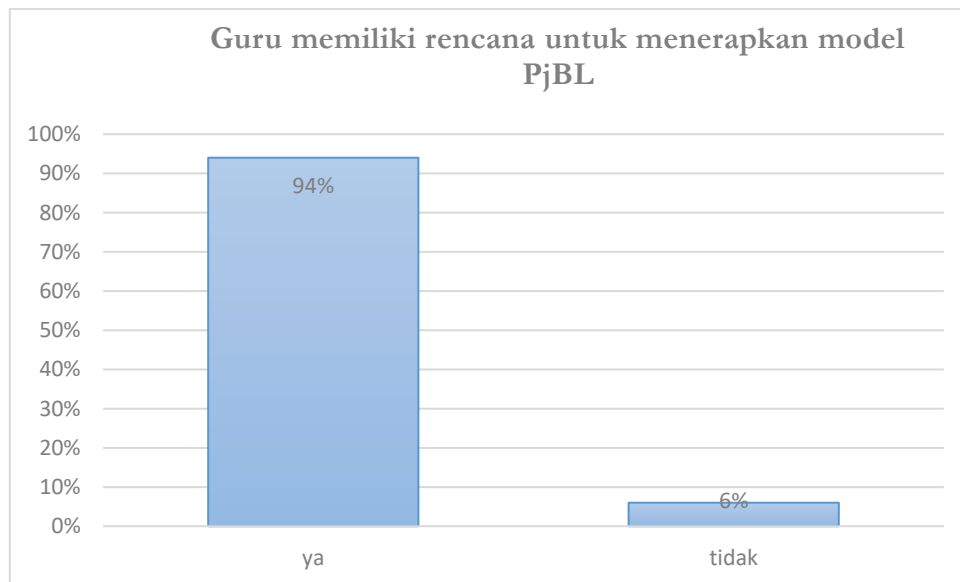
Gambar 2 Deskripsi Guru memiliki rencana untuk menerapkan model PjBL

Secara keseluruhan, hasil wawancara baik dengan guru maupun siswa memperkuat temuan bahwa penerapan PjBL yang dipadukan dengan metode tanya jawab meningkatkan keterlibatan siswa dalam pembelajaran, membantu mereka memahami materi PAI dengan lebih baik, serta mengembangkan keterampilan kolaborasi dan komunikasi. Meskipun ada tantangan dalam penerapannya, seperti waktu yang lebih panjang untuk penyelesaian proyek dan kesulitan melibatkan semua siswa secara merata, pendekatan ini tetap dinilai lebih efektif dibandingkan metode pembelajaran konvensional.