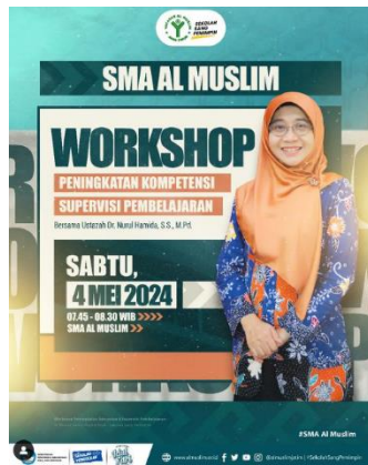
Gambar 5 Workshop Supervisi Pembelajaran

terhadap materi. Penggunaan platform My Al Muslim sebagai alat pendukung pembelajaran digital telah terbukti efektif, memungkinkan siswa untuk mengakses berbagai sumber belajar secara interaktif. Selain itu, wawancara dengan kepala sekolah dan wakil kepala kurikulum menyoroti dua faktor utama yang mempengaruhi transformasi ini: supervisi pembelajaran yang dilakukan oleh pihak sekolah untuk memastikan kesesuaian dengan perkembangan zaman, dan penyediaan sarana dan prasarana yang mendukung proses belajar mengajar.