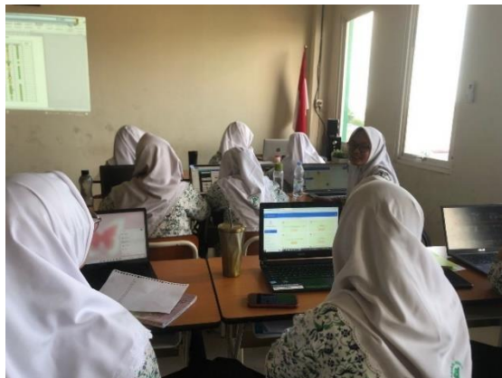
Gambar 2 Pembelajaran Digital

bahwa transformasi ini harus dilakukan secara berkelanjutan untuk meningkatkan kualitas pendidikan, mencakup pengembangan pengetahuan, keterampilan soft skill, dan karakter siswa. Pendekatan pengajaran harus beralih dari model yang berpusat pada guru (teacher-centered) menjadi berpusat pada siswa (student-centered), serta mengintegrasikan media pembelajaran yang lebih kreatif dan kontekstual agar relevan dengan kehidupan siswa.