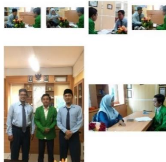
Gambar 1 Pelaksanaan Wawancara, Observasi, dan Dokumentasi

Peneliti melakukan studi kasus kualitatif di SMA Al-Muslim Sidoarjo dengan metode observasi, wawancara, dan dokumentasi untuk mengungkap dinamika dan efektivitas model pembelajaran yang diterapkan. Data diperoleh melalui observasi kelas, wawancara mendalam dengan guru dan siswa, serta analisis dokumen terkait, yang mengungkap wawasan tentang penerapan model pembelajaran inovatif serta tantangan yang dihadapi dalam meningkatkan kualitas pendidikan agama Islam di era Society 5.0. Dengan fokus pada transformasi model pembelajaran yang lebih interaktif dan berbasis proyek, penelitian ini menyajikan pandangan komprehensif mengenai efektivitas model tersebut di SMA Al-Muslim.