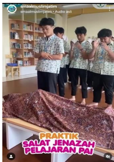
Gambar 6 Pengumpulan Tugas Melalui Platform Instagram

Berdasarkan hasil observasi dan wawancara di SMA Al Muslim, ditemukan bahwa sekolah telah menerapkan platform digital dan menyediakan akses internet untuk mendukung pembelajaran, terutama dalam Pendidikan Agama Islam (PAI). Infrastruktur teknologi ini memungkinkan siswa dan guru untuk menggunakan berbagai aplikasi pembelajaran online, sehingga menciptakan pengalaman belajar yang interaktif dan efektif, sesuai dengan tuntutan era digital 5.0. Penerapan transformasi model pembelajaran yang lebih interaktif dan berbasis teknologi, seperti penggunaan media digital, diskusi kelompok, dan project-based learning, meningkatkan keterlibatan siswa dan membantu mereka mengembangkan keterampilan kritis. Guru menggunakan alat digital, seperti PowerPoint, platform My Al Muslim, dan Quizizz, untuk membuat pembelajaran lebih menarik, serta memungkinkan penilaian yang lebih efektif. Keseluruhan proses ini tidak hanya memperbaiki kualitas pembelajaran PAI, tetapi juga mempersiapkan siswa untuk menghadapi tantangan zaman modern, sekaligus mendukung praktik ramah lingkungan dengan mengurangi penggunaan kertas.