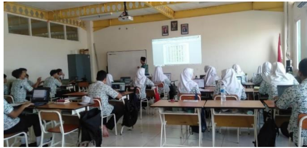
Gambar 4 Pembelajaran Berlangsung

Data observasi menguatkan pernyataan mengenai penerapan model pembelajaran berbasis digital oleh guru Pendidikan Agama Islam (PAI) di SMA Al Muslim. Hasil pengamatan menunjukkan bahwa para guru secara aktif menggunakan berbagai teknologi dan platform digital dalam proses pembelajaran, seperti My Al Muslim, Quizizz, Kahoot, dan PowerPoint. Dengan pendekatan ini, guru dapat menyampaikan materi, berinteraksi dengan siswa, dan melakukan evaluasi secara efektif, menunjukkan komitmen mereka untuk menyesuaikan metode pembelajaran dengan perkembangan zaman dan menjaga relevansi pendidikan agama Islam. Transformasi ini tidak hanya menarik minat siswa, tetapi juga memberikan kesempatan untuk menyebarkan nilai-nilai pendidikan melalui platform digital, terutama dalam situasi yang menantang seperti pandemi.