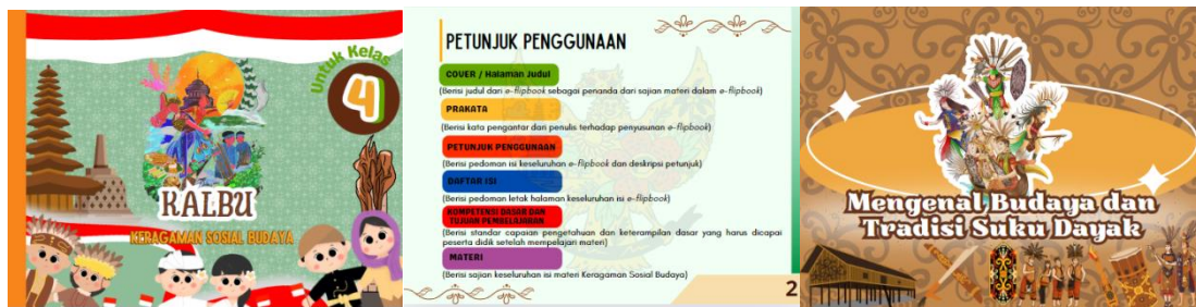
Gambar 2. Proses desain media