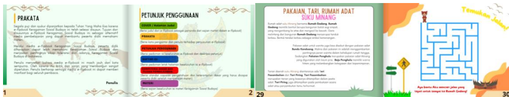
Gambar 3. Hasil desain media e-flipbook

Setelah proses pengembangan media E-Flipbook selesai, selanjutnya akan divalidasi oleh para ahli. Media E-Flipbook harus melaksanakan proses validasi dengan tujuan agar memperoleh data kelayakan produk. Ahli media dan ahli materi akan melakukan proses validasi atau verifikasi berdasarkan media E-Flipbook . Hasil dari produk pengembangan akan dinilai dan diserahkan kepada validator berupa media E-Flipbook dan instrumen validasi. Proses validasi dilakukan sesuai dengan petunjuk penilaian, memberikan saran dan komentar terhadap media pembelajaran, kemudian peneliti melakukan revisi dan setelah media diperbaiki langkah selanjutnya validator akan memberikan penilaiannya terhadap media pembelajaran dengan opsi penilaian sesuai keterangan pada petunjuk penilaian. Selanjutnya hasil penilaian dari validator dilanjutkan ke langkah menganalisis data dengan teknik skor rata-rata keseluruhan (Rika Yulia et al., 2024).