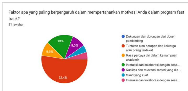
Gambar 1. Grafik pengaruh motivasi mahasiswa mengikuti fast track

Kemudian beberapa mahasiswa melihat Program Fast Track sebagai cara untuk menghindari penundaan dalam studi mereka. Mereka merasa bahwa program ini memberikan mereka struktur dan kerangka waktu yang jelas untuk menyelesaikan pendidikan mereka, sehingga mengurangi risiko terjebak dalam penundaan atau kebingungan terkait tujuan akademis dan karir. Struktur yang jelas ini memberikan mereka rasa tujuan dan arah yang lebih kuat.