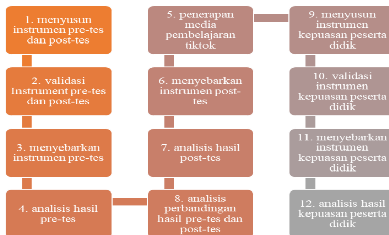
Gambar 1. Rancangan penelitian

Untuk mengetahui peningkatan kemampuan peserta didik kelas 11 MA AI-Bairuny Jombang pada materi akidah akhlak berbantuan media sosial tiktok. Penelitian menggunakan metode pendekatan kuantitatif. Rancangan atau tahapan penelitian dapat dilihat dalam diagram alur: