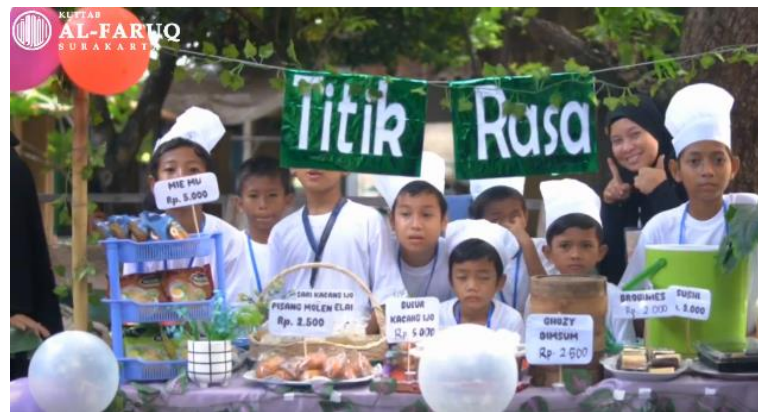
Gambar 2. Menghias stand tiap kelompok

Program market day melibatkan santri secara aktif dalam seluruh proses pembelajaran, sehingga lebih interaktif dan menyenangkan. Santri berlatih jual beli dengan temannya, guru, wali santri, maupun pihak luar yang ikut menghadiri market day . Secara sadar dan spontan santri melaksanakan proses berpikir kritis dan kreatif. Santri juga belajar literasi dengan menghitung jumlah belanjaan, jumlah pendapatan, jumlah pengeluaran, serta menulis sederhana barang yang terjual dan tidak, dengan dipandu oleh 1 guru dan 1 wali santri di tiap kelompok. Kegiatan ini sebagaimana tercermin pada gambar 2 dan 3. Berdasarkan pengamatan peneliti saat acara berlangsung, santri merasa senang, antusias, dan bersemangat.