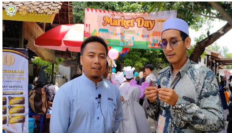
Gambar 4. Survei pengunjung market day

kurang diminati, kelompok yang terbaik dalam berdagang, serta kelemahan kelompok dalam berdagang. Lebih lanjut, pengunjung market day diwawancarai untuk mengetahui pendapat mereka tentang acara tersebut. Dari hasil survei panitia kepada para pengunjung, menunjukkan skor kepuasan program market day di Kuttab Al Faruq pada angka 9/10. Survei pengunjung ini sebagaimana dilakukan seperti pada gambar 4.