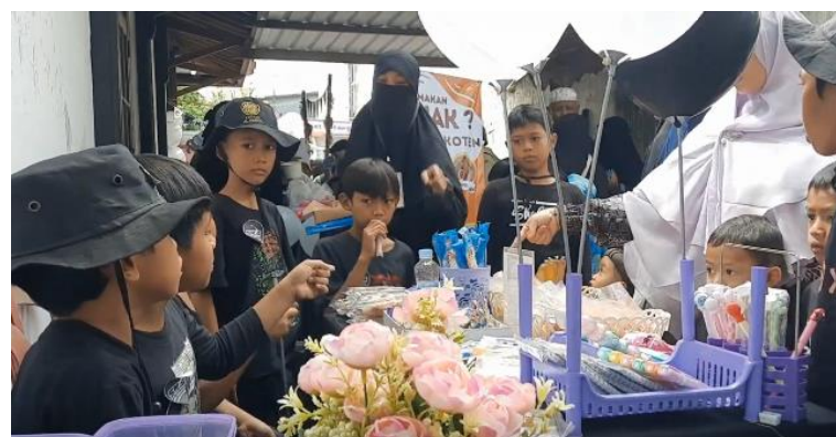
Gambar 3. Kegiatan jual beli saat market day

Tahap ketiga yaitu setelah acara market day digelar, terdapat evaluasi terkait pelaksanaan market day yang telah digelar. Evaluasi menjadi bagian penting dalam kegiatan. Evaluasi ini dilaksanakan melalui beberapa cara, antara lain panitia market day dari pihak internal Kuttub Al Faruq mengadakan diskusi guna mengetahui kekurangan dan kelebihan program tersebut. Data penjualan juga dianalisis untuk mengetahui produk yang paling diminati, produk yang