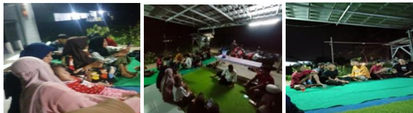
Gambar 3 masyarakat Desa Sukarame pada saat kegiatan musyawarah

Pada pelaksanaan tradisi panjang mulud Nabi tentunya sangat dinanti setiap tahunnya dan digelar dengan acara yang begitu sangat meriah di Desa Sukarame, dimana biasanya diawali dengan musyawarah. Musyawarah disini memiliki rasa satu kesatuan yang terikat sehingga dapat memiliki rasa perasaan senasib, musyawarah pun dilakukan karena berasal dari satu wilayah yang sama yang bertujuan untuk mempersiapkan diri agar saling terlibat dalam pelaksanaannya dengan keterlibatan mereka tentunya melalui aktivitas musyawarah yang melibatkan dari berbagai pihak diantaranya mulai dari masyarakat setempat, ketua RT serta Kepala Desa Sukarame Kecamatan Cikeusal.