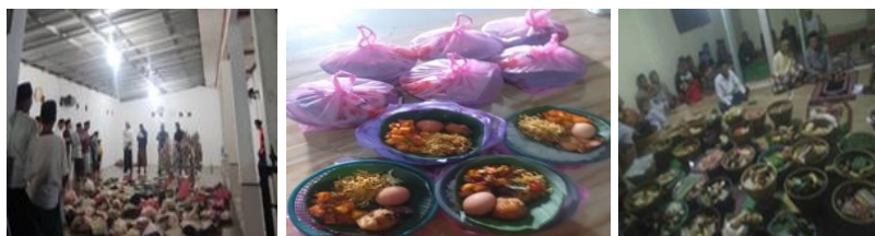
Gambar 4 masyarakat Desa Sukarame pada saat melakukan kegiatan ngariung

Kegiatan ngariung yang dilakukan oleh masyarakat Desa Sukarame bukan hanya dilakukan untuk mendoakan sesuatu tetapi juga sudah menjadi sebuah kebiasaan yang rutin dilakukan setiap kegiatan selamatan yang dapat dijadikan tempat untuk bersosialisasi bagi masyarakat Desa Sukarame karena sebelum dimulainya acara kegiatan ngariung masyarakat berkumpul terlebih dahulu dengan tujuan untuk menunggu masyarakat yang belum datang, mereka secara bersama-sama duduk melingkar sambil mengobrol mengelilingi nasi beserta lauk pauk yang biasa masyarakat Desa Sukarame sebut dengan sebutan nasi berkat. Pada kegiatan ngariung yang dilakukan masyarakat Desa Sukarame yaitu dengan mempertahankan keyakinan yang dipercayai agar membuat terjaganya ikatan solidaritas masyarakat yang kuat yang dapat menjadikan solidaritas sosial menjadi selalu terjaga selamanya hingga anak cucu keturunan mereka nanti.