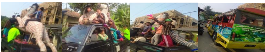
Gambar 1 kegiatan arak-arakan pada tradisi panjang mulud Nabi

Tradisi arak-arakan merupakan sebuah tradisi yang dapat dinilai cukup baik untuk membangun sebuah kerja sama baik kelompok komunitas Islam, tokoh agama maupun masyarakat setempat, dengan adanya aktivitas arak-arakan mulai dari anak-anak sampai dengan orang dewasa, mereka dapat mempertahankan sifat kerja samanya pada kegiatan arak-arakan. Kegiatan tradisi arak-arakan masyarakat Desa Sukarame dilakukan dengan cara meriah tentunya mensosialisasikannya terlebih dahulu kepada masyarakat Desa lain dengan cara pawai secara bersama-sama mengelilingi setiap Desa menggunakan kendaraan sepeda motor dan juga odong-odong yang menandakan bahwa masyarakat Desa Sukarame akan melakukan tradisi panjang mulud Nabi