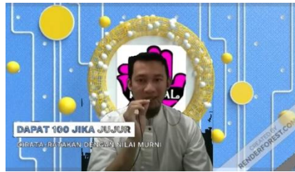
Gambar 4 Vidio pembelajaran

Berikut terkait dengan potongan contoh video pembelajaran yang dikembangkan oleh guru yang termuat dalam gambar 4, dan 5.