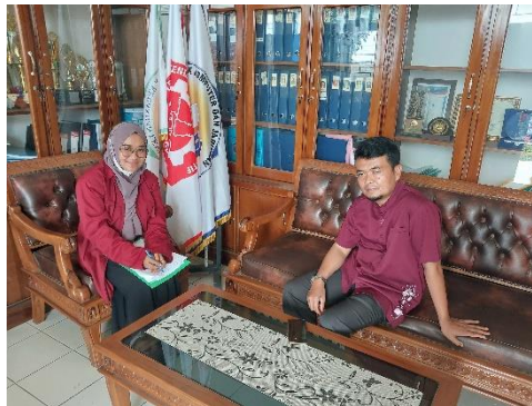
Gambar 1 Wawancara dengan Kepala Sekolah

Berdasarkan hasil wawancara dengan kepala sekolah, guru PAI di sekolah SMKN Sukasari dalam menganalisis kebutuhan siswa. Pertama wawancara dilakukan kepada kepala sekolah untuk mendapatkan gambaran umum mengenai kebutuhan siswa di SMKN Sukasari yang termuat dalam gambar 1 di bawah ini.