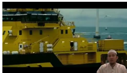
Gambar 5 Vidio pembelajaran