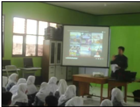
Gambar 3 Siswa dalam Proses Pembelajaran

berlangsung, siswa cenderung aktif, antusias, dan lebih menyimak pembelajaran. Terlihat pada gambar 3 di bawah ini.