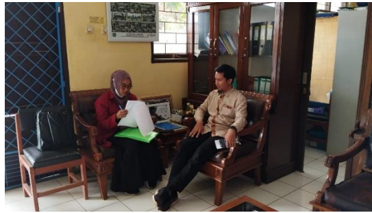
Gambar 2 Wawancara dengan Guru PAI

Menurut hasil wawancara tersebut dalam menganalisis kebutuhan siswanya, adalah sebagai berikut: