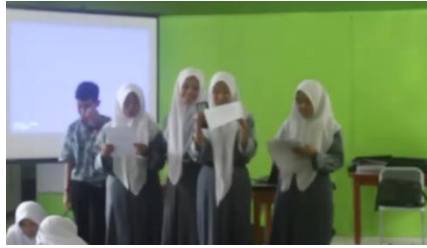
Gambar 8 Partisipasi Siswa

Tahap ini siswa menganalisis video yang sudah ditayangkan yang kemudian dipresentasikan setiap kelompok, menurut guru PAI :