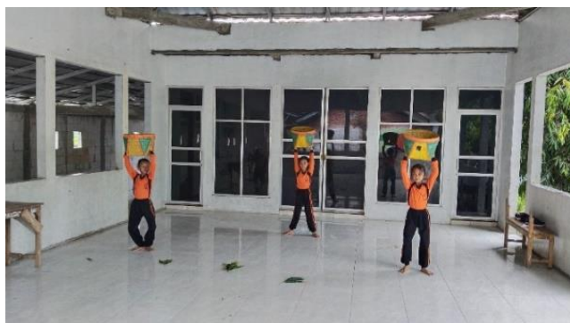
Gambar 3. Mengangkat bakul

Dengan posisi berdiri dengan mengangkat bakul masing-masing dengan posisi kaki Mendhak.