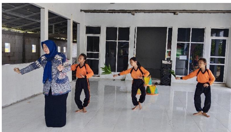
Gambar 6. Tahap Pematangan Proses Kreasi

Tahap pematangan atau inkubasi adalah situasi ide yang muncul kemudian digali dengan kesadaran (Sukma, 2021). Usaha memahami keterkaitan satu informasi dengan informasi yang lain dengan beserta mencari pemecahan masalah. Tahap pematangan ini yang dilakukan oleh guru pembimbing dari pemecahan masalah, mulai dari gerakan-gerakan tari yang belum dikuasai hingga siswa mampu menghafalkan gerakan.