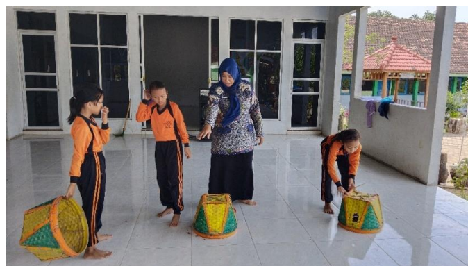
Gambar 5. Tahap Persiapan Proses Kreasi

Pertama tahap persiapan yaitu dari munculnya minat kreatif seseorang mempersiapkan diri memecahkan masalah dengan mengumpulkan data atau informasi, mempelajari pola berpikir dari orang lain, bertanya kepada orang lain, dan mencari jawaban. Pada tahap persiapan ini mendatangkan sebuah ide dan menimbulkan sebuah kemungkinan (Nuriawati, 2021)