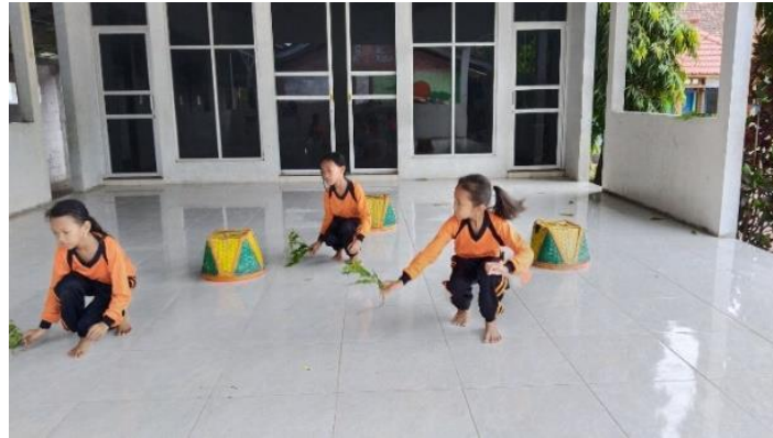
Gambar 4. Jalan jongkok sambil berjalan mundur

Proses menanam padi atau sering disebut dengan Tandur Pari merupakan cara menanam yang dilakukan dengan berjalan membungkuk mundur. Dengan membawa sebuah padi yang masih hijau menanam dengan berjalan membungkuk mundur agar tidak merusak padi yang sudah di tanam atau ditancapkan ketanah.