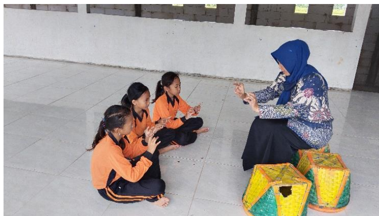
Gambar 48 Tahap Evaluasi Proses Kreasi

Tahap evaluasi atau verifikasi adalah mengacu pada upaya evaluasi dengan Langkah-langkah yang digunakan untuk memecahkan masalah dan dapat memberikan hasil yang sesuai (Asmawati, 2017). Guru pembimbing dengan usahanya melatih siswa dengan rasa sabar, memulai dari gerakan awal hingga akhir yang belum dihafalkan atau dikuasai. Kemudian ketika siswa sudah mampu menguasai dan berani untuk berlatih secara individu maupun kelompok masih dengan pengawasan guru pembimbing.