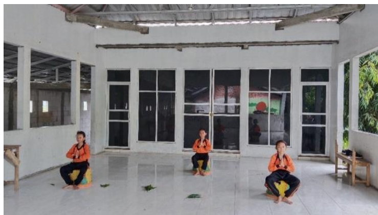
Gambar 1. Duduk Sembahan

Dengan gerakan duduk di bakul besar masing-masing posisi kaki yang membentuk V dan kedua tangan sembah atau seperti berdoa.