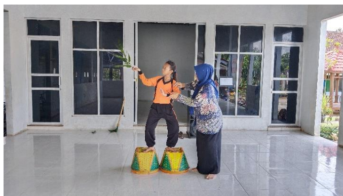
Gambar 7. Tahap Gagasan Baru Proses Kreasi

Tahap gagasan baru atau ilmuinasi adalah tahap penemuan atau perenungan kembali atas ide-ide yang telah diolah sesuai kemampuan pribadi (Sukma, 2021). Guru pembimbing mencari cara atau solusi untuk masalah dalam berlatih menari terutama gerakan kreasi yang mudah dihafalkan dan dikuasai.