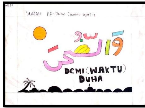
Gambar 5 Karya Wd

Karya seni selanjutnya diatas menggunakan warna diantaranya : oranye pada huruf wau, hijau muda pada huruf alif, kuning pada huruf dho', biru muda pada harokat fathah, merah pada harokat fathah dan tasydid, warna merah muda pada harokat dhlumah dan ungu pada huruf lam dan kha'. Menurut Rengganis (2017) Warna ungu termasuk dalam kelompok warna hangat. Warna ungu menyampaikan pengaruh, pengetahuan tersembunyi, pencerahan dan keyakinan yang mendalam.