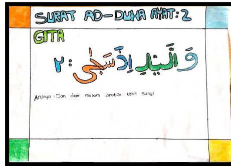
Gambar 4 Karya Gt

kaligrafi yang berwarna hitam. Untuk menambah keindahan karya tersebut ditambahkan gambar pohon berwarna hijau pada daun dan coklat pada batangnya, terletak di pojok kanan bawah dari halaman karya serta gambar awan diatas karya seni kaligrafi berwarna biru muda.