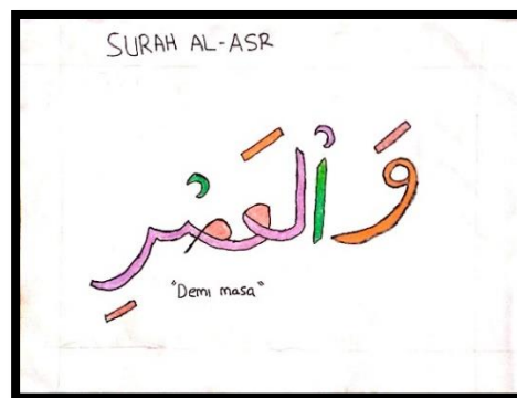
Gambar 7 Karya Tk

Karya seni diatas menggunakan warna diantaranya : oranye pada huruf alif serta harokat kasroh dan sukun, hijau muda pada huruf lam dan ro', merah pada huruf (kha', mim dan nun), hijau tua pada huruf alif dan hrokat fathah dan sukun, coklat pada huruf lam dan ro', ungu pada huruf (kha', ya', mim, harokat fathah dan tasydid). Bentuk dari karya tersebut menggunakan garis lurus pada huruf alif dan lam, serta menggunakan garis lengkung pada huruf ro', mim, nun, ya' serta harokat sukun dan tasydid. Selain menggunakan garis lengkung dan lurus karya tersebut juga menggunakan titik yang terdapat pada huruf ya'dan nun. Dalam karya tersebut dituliskan nama dan ayat surat terletak di paling atas, nama dari penulis karya kaligrafi tersebut, pada paling bawah ditulis arti dari ayat yang ditulis untuk kaligrafi semua menggunakan warna hitam.