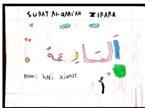
Gambar 3 Karya Zfr

pada huruf alif, biru harokat fathah dan tasydid, dan coklat pada huruf (ya', ta', wau). Karya tersebut diawali pewarnaan huruf dengan warna kuning pada huruf alif. Menurut Rengganis (2017) warna kuning melambangkan kegembiraan. Warna ini memiliki sifat bebas dan santai, masalah mudah ditunda. Berubah tapi penuh harapan dan ambisi seperti langit. Bentuk dari karya tersebut menggunakan garis lurus pada huruf alif dan lam serta menggunakan garis lengkung pada pada nun, kepala wau, ta'dan ya'. Selain menggunakan garis lengkung dan lurus karya tersebut juga menggunakan titik yang terdapat pada huruf ta', ya', nun, dan za'. Karya tersebut dituliskan nama dan ayat surat terletak di paling atas halaman karya. Kemudian, nama dari penulis karya tersebut, pada paling bawah ditulis arti dari ayat yang ditulis untuk kaligrafi yang berwarna hitam. Untuk menambah keindahan karya tersebut ditambahkan gambar pohon berwarna hijau pada daun dan coklat pada batangnya, terletak di pojok kiri bawah dari halaman karya.