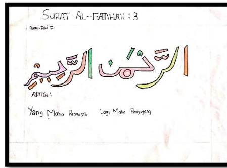
Gambar 6 Karya Ff

Karya seni diatas menggunakan warna diantaranya : oranye pada huruf alif serta harokat kasroh dan sukun, hijau muda pada huruf lam dan ro', merah pada huruf (kha', mim dan nun), hijau tua pada huruf alif dan hrokat fathah dan sukun, coklat pada huruf lam dan ro', ungu pada huruf (kha', ya', mim, harokat fathah dan tasydid). Bentuk dari karya tersebut menggunakan garis lurus pada huruf alif dan lam, serta menggunakan garis lengkung pada huruf ro', mim, nun, ya' serta harokat sukun dan tasydid. Selain menggunakan garis lengkung dan lurus karya tersebut juga menggunakan titik yang terdapat pada huruf ya'dan nun. Dalam karya tersebut dituliskan nama dan ayat surat terletak di paling atas, nama dari penulis karya kaligrafi tersebut, pada paling bawah ditulis arti dari ayat yang ditulis untuk kaligrafi semua menggunakan warna hitam.