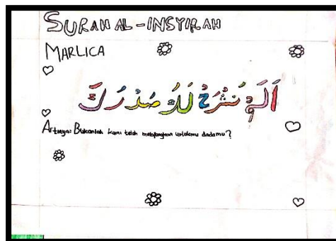
Gambar 8 Karya Mc

shod, ro', harokat sukun. Dalam karya tersebut dituliskan nama dan ayat surat terletak di paling atas, pada paling bawah ditulis arti dari ayat yang ditulis untuk kaligrafi semua menggunakan warna hitam.