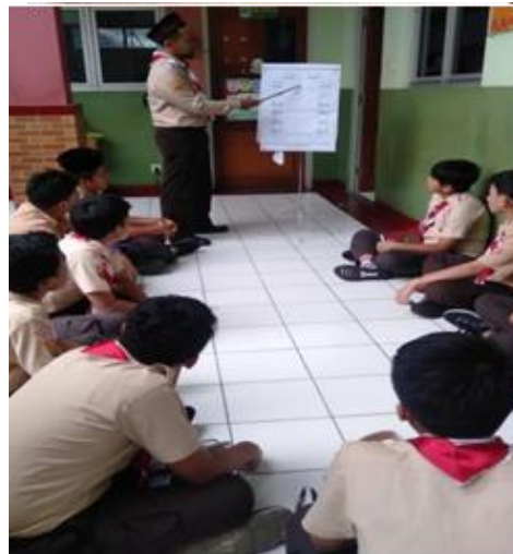
Gambar.1 Pembelajaran Al-Qur'an dengan Metode Tilawati MTs Al-Ianah Klari Karawang

Pembelajaran menggunakan metode tilawati hal ini dapat di pahami bahwa perlu di perhatikan dengan adanya media dan sumber belajar, hal ini dapat di pahami melalui buku yang di berikan kepada siswa agar meliputi banyak hal mulai dari buku tilawati jilid 1-6, sampai dengan perlengkapan mengajar yang meliputi alat yang di peragakan di sekolah guna memudahkan siswa dalam membacanya seperti tiang penyanggah peraga, alat petunjuk. Seperti yang di contohkan pada gambar berikut ini.