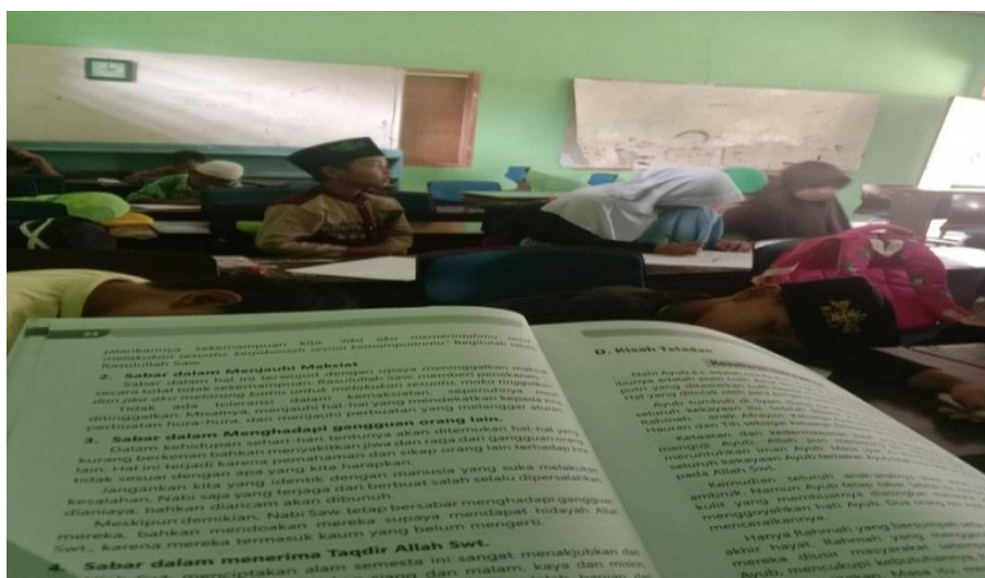
Gambar 2 sedang menjelaskan materi Fiqih

“Metode yang digunakan untuk pembelajaran di Madrasah Diniyah Riyadul Athfal yaitu dengan ceramah dan tanya jawab” (Pangkalan 06 Juni 2022)