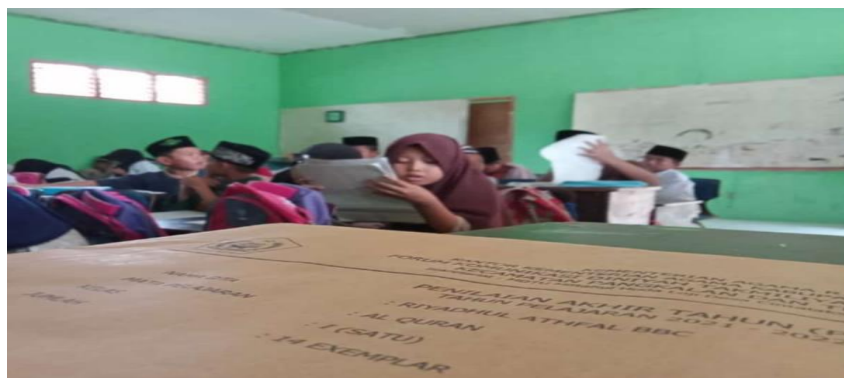
Gambar 3 sedang ujian semesteran sebagai evaluasi

Dalam setiap usai pembelajaran juga selalu di adakan evaluasi antara ustadz dan santri yaitu dengan menanyakan kepada santrinya mengenai pemahamannya dalam pembelajaran yang sudah diberikan. Selain itu di Madrasah Diniyah Riyadul Athfal evaluasi yang lebih ditekankan adalah mengenai hafalan-hafalan juz’amma dan membaca iqra’/Al-Qur’an dengan baik dan benar. Biasanya evaluasi hafalan juz’amma dilakukan dengan sistem setoran tergantung kemampuan santri hafal berapa ayat sedangkan membaca iqra’/Al-Qur’an dengan cara membaca secara berulang-ulang sampai bacaannya baik dan benar.