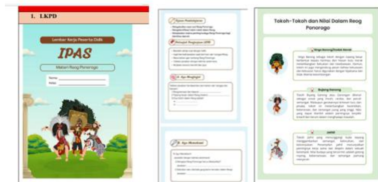
Gambar 1 Desain Modul Ajar

Berdasarkan Gambar 1 modul ajar dirancang dengan tampilan yang menarik menggunakan kombinasi gambar, warna, dan materi yang sesuai dengan siswa sekolah tersebut. Modul juga berisi tahap-tahap dari PBL yang membuat siswa mengerti akan materi nilai budaya Reog Ponorogo secara lebih mendalam dan interaktif