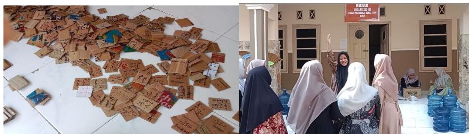
Gambar 1. Permainan Quiz Team

Evaluasi pembelajaran terhadap implementasi permainan Quiz Team dilakukan secara terintegrasi selama permainan berlangsung. Salah satu anggota kelompok bertugas menuliskan setiap mufrodat yang berhasil ditebak. Setelah seluruh isyarat diberikan, kelompok melakukan verifikasi jawaban dengan mengungkapkan kelima mufrodat yang telah dijawab kepada penyisyrat. Apabila ditemukan jawaban yang salah, guru meminta anggota kelompok yang bersangkutan diminta mengulang dengan membaca mufrodat yang benar sebanyak 5 kali sebagai bentuk penguatan hafalan (reinforcement). Evaluasi formatif ini dianggap berhasil jika pada putaran berikutnya, kesalahan yang sama tidak terulang dan peserta didik mampu menjawab mufrodat yang sebelumnya salah dengan benar.