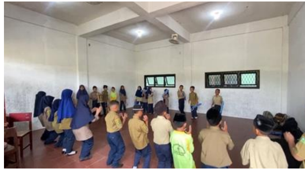
Gambar 6 Sesi Latihan Tari Tor-Tor

Puncak kegiatan ini adalah pada acara Festival Projek Pancasila, di mana seluruh siswa SD Muhammadiyah 29 Sunggal menampilkan projek P5 mereka. Festival ini menjadi ajang di mana setiap kelompok siswa mempresentasikan hasil latihan mereka dalam permainan angklung maupun tari Tor-Tor secara kolaborasi, di hadapan seluruh komunitas sekolah, termasuk teman-teman sekelas, guru, dan orang tua. Pertunjukan ini tidak hanya menjadi kesempatan untuk menunjukkan kemampuan teknis siswa, tetapi juga sebagai perayaan kerja sama dan usaha kolektif yang telah mereka lakukan.