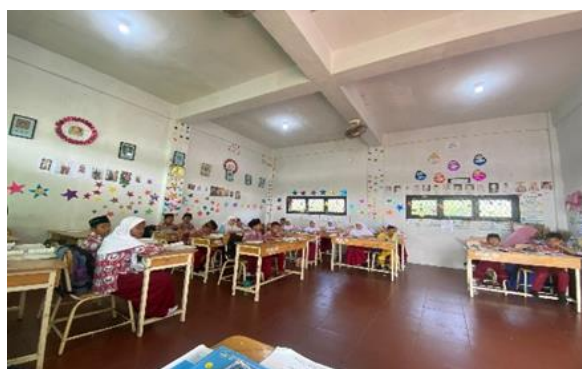
Gambar 1 Observasi Awal Kegiatan

Hasil observasi dan wawancara menunjukkan bahwa banyak siswa kurang mengenal budaya dan seni yang ada di Indonesia. Fenomena ini diduga disebabkan oleh pengaruh kemajuan teknologi, di mana siswa lebih banyak terpapar pada tren-tren terkini dari media sosial seperti TikTok dan Instagram . Wawancara yang dilakukan dengan guru dan siswa juga mengungkapkan bahwa sebagian besar siswa tidak memiliki pengetahuan yang memadai tentang seni tradisional Indonesia, termasuk seni yang berasal dari Sumatera Utara.