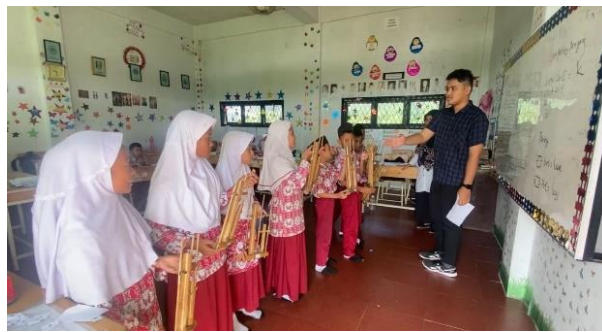
Gambar 5 Sesi Latihan Alat Musik Angklung Projek P5

Dalam pelaksanaan kegiatan ini, siswa diarahkan untuk bekerja sama dalam kelompok. Setiap kelompok memiliki tanggung jawab yang berbeda, seperti mengatur nada pada angklung, mempelajari koreografi tari, dan mengoordinasikan waktu serta urutan penampilan. Melalui pendekatan ini, siswa tidak hanya belajar tentang seni tradisional, tetapi juga mengembangkan keterampilan sosial seperti komunikasi dan koordinasi. Gotong royong menjadi nilai penting yang ditekankan, di mana setiap siswa belajar untuk saling mendukung dalam mencapai hasil terbaik.