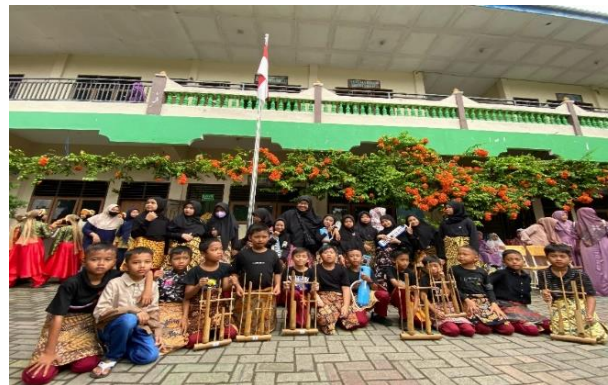
Gambar 7 Festival Projek Pancasila SD Muhammadiyah 29 Sunggal 2024

Puncak kegiatan ini adalah pada acara Festival Projek Pancasila, di mana seluruh siswa SD Muhammadiyah 29 Sunggal menampilkan projek P5 mereka. Festival ini menjadi ajang di mana setiap kelompok siswa mempresentasikan hasil latihan mereka dalam permainan angklung maupun tari Tor-Tor secara kolaborasi, di hadapan seluruh komunitas sekolah, termasuk teman-teman sekelas, guru, dan orang tua. Pertunjukan ini tidak hanya menjadi kesempatan untuk menunjukkan kemampuan teknis siswa, tetapi juga sebagai perayaan kerja sama dan usaha kolektif yang telah mereka lakukan.