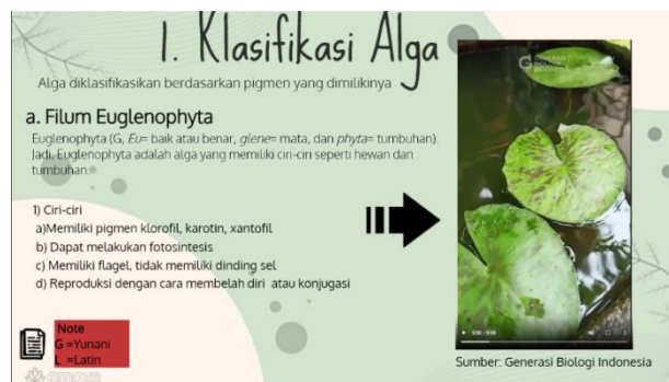
Gambar 2. Tampilan awal media pembelajaran