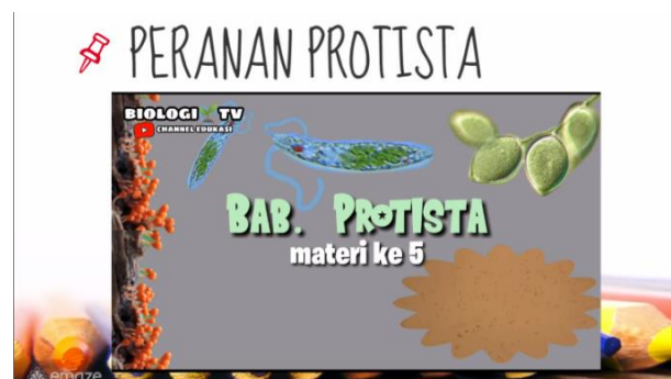
Gambar 3. Tampilan embedded video pada media