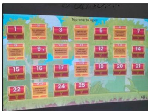
Gambar 2. Contoh Kuis Menggunakan Wordwall

Di sisi lain, lembaga pendidikan tradisional seperti pondok pesantren memiliki akar budaya pembelajaran diniyah yang masih sangat didominasi oleh metode klasik seperti ceramah. Dominasi penggunaan metode ceramah menyebabkan siswa cenderung pasif dan kurang termotivasi (Abulais & Nikmah, 2026). Fenomena ini menjadi isu krusial dimana pesantren dituntut menjaga relevansi keilmuannya di tengah arus modernisasi tanpa menggerus identitas tradisionalnya. Strategi integratif ini menjadi kunci bagi pesantren untuk menjawab tantangan zaman (Yusuf & Ali, 2025). Aktivitas belajar siswa menjadi lebih menyenangkan dan lebih baik berkat fasilitas dan peralatan yang memadai.