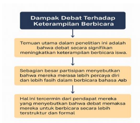
Gambar 1: Peningkatan keterampilan berbicara dan kefasihan Siswa

Temuan utama dalam penelitian ini adalah bahwa debat secara signifikan meningkatkan keterampilan berbicara siswa. Sebagian besar partisipan menyebutkan bahwa mereka merasa lebih percaya diri dan lebih fasih dalam berbicara bahasa Arab. Hal ini tercermin dari pendapat mereka yang menyebutkan bahwa debat memaksa mereka untuk berbicara secara lebih terstruktur dan formal.