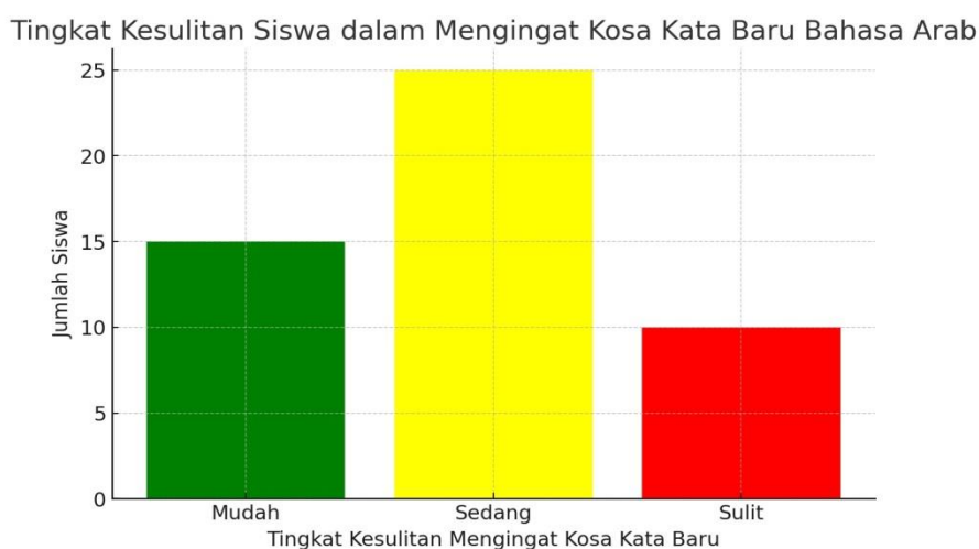
Gambar 5: Grafik tingkat kesulitan siswa dalam mengingat kosa kata baru

Namun, meskipun sebagian besar siswa merasakan manfaat yang signifikan dari debat, ada beberapa partisipan yang mengungkapkan kesulitan dalam mengingat kosa kata baru yang mereka pelajari selama debat. Salah seorang siswa mengungkapkan bahwa meskipun ia merasa lebih percaya diri dalam berbicara, ia masih mengalami kesulitan untuk mengingat dan menggunakan beberapa kata baru yang diperoleh selama latihan debat. Ini menunjukkan bahwa meskipun debat memberikan dampak positif secara umum, ada beberapa tantangan yang perlu diperhatikan dalam proses pembelajaran.