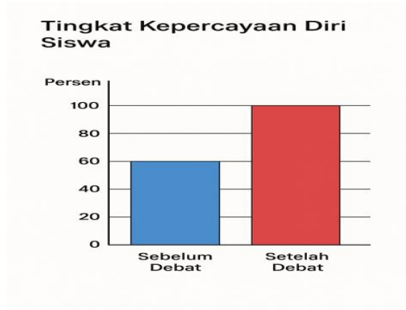
Gambar 3: grafik tingkat kepercayaan diri siswa sebelum dan setelah mengikuti debat

Lebih jauh lagi, hasil wawancara dengan siswa menunjukkan bahwa debat berperan penting dalam melatih mentalitas siswa. Sebagian besar partisipan mengungkapkan bahwa mereka merasa lebih percaya diri setelah mengikuti beberapa sesi latihan debat secara konsisten. Mereka menyatakan bahwa sebelumnya mereka merasa cemas dan kurang percaya diri dalam berbicara bahasa Arab, namun seiring berjalannya waktu, mereka mulai merasa lebih nyaman dan mampu berbicara dengan lebih lancar. Kepercayaan diri yang meningkat ini tidak hanya dirasakan dalam konteks debat, tetapi juga dalam situasi berbicara lainnya.