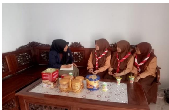
Gambar 3: wawancara dengan siswi MTs Nurul Falah Binakal

Dari hasil wawancara dengan beberapa peserta didik dan guru di kelas IX di MTs Nurul Falah Binakal, diperoleh tanggapan positif mengenai penerapan efektivitas metode fun learning dalam pembelajaran bahasa Arab: