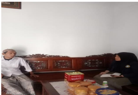
Gambar 2: wawancara dengan Guru MTs Nurul Falah Binakal

Dari hasil wawancara dengan beberapa peserta didik dan guru di kelas IX di MTs Nurul Falah Binakal, diperoleh tanggapan positif mengenai penerapan metode fun learning dalam pembelajaran bahasa Arab: