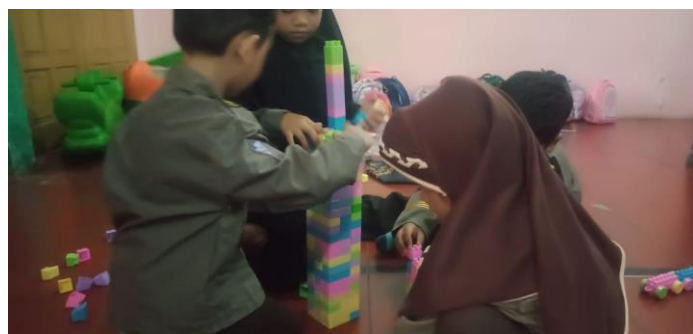
Gambar 4. Anak didik RA Al Akhyar sedang belajar dengan permainan

Adapun metode evaluasi dilakukan secara informal dan formatif, seperti mengamati kemampuan anak dalam menyebut angka dalam bahasa Arab atau mencocokkan gambar dengan kata Arab melalui lembar kerja. Ini mencerminkan prinsip penilaian otentik, di mana evaluasi dilakukan melalui aktivitas nyata dan bukan melalui tes tertulis formal, yang belum sesuai untuk usia anak-anak RA (Azzahro & Salama, 2022).