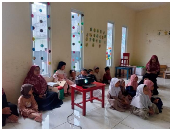
Gambar 2. Anak didik RA Al Akhyar menonton video edukatif

Salah satu metode utama yang digunakan adalah belajar sambil bermain, yang diwujudkan melalui aktivitas seperti bernyanyi, bertepuk tangan, menonton video edukatif, serta mewarnai kaligrafi atau huruf Arab. Metode ini selaras dengan teori pendidikan anak usia dini, yang menekankan bahwa anak usia praoperasional (2-7 tahun) belajar melalui pengalaman konkret dan kegiatan sensorimotor yang bermakna (Santoso, 2018).