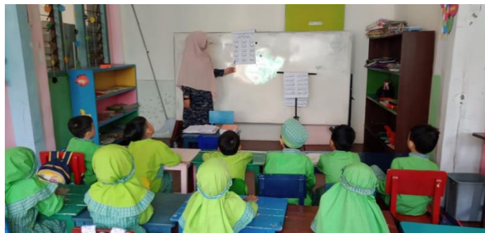
Gambar 3. Anak didik RA Al Akhyar belajar huruf hijaiyyah

Adapun metode evaluasi dilakukan secara informal dan formatif, seperti mengamati kemampuan anak dalam menyebut angka dalam bahasa Arab atau mencocokkan gambar dengan kata Arab melalui lembar kerja. Ini mencerminkan prinsip penilaian otentik, di mana evaluasi dilakukan melalui aktivitas nyata dan bukan melalui tes tertulis formal, yang belum sesuai untuk usia anak-anak RA (Azzahro & Salama, 2022).