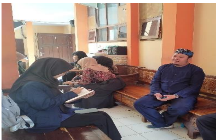
Gambar 2. Wawancara Peneliti dengan guru PAI

Oleh karena itu, pemahaman yang mendalam dan upaya nyata untuk mengajarkan sekaligus mengimplementasikan nilai luhur moderasi beragama menjadi sangat penting. Moderasi beragama tidak hanya berfungsi sebagai penangkal radikalisme tetapi juga sebagai fondasi untuk menciptakan masyarakat yang harmonis dan toleran. Dengan menanamkan nilai-nilai moderasi beragama, seperti penghargaan terhadap perbedaan, toleransi, dan sikap inklusif, siswa akan lebih siap untuk menolak ideologi ekstrem dan berperan aktif dalam menjaga kerukunan di lingkungan sekolah dan masyarakat. Lembaga Pendidikan, dengan demikian, memiliki tanggung jawab besar untuk memastikan bahwa siswa mendapatkan pendidikan yang tidak hanya berfokus pada aspek akademis, tetapi juga pada pembentukan karakter dan pemahaman yang mendalam tentang pentingnya hidup berdampingan secara damai dalam keragaman (Milianty et al., 2023).