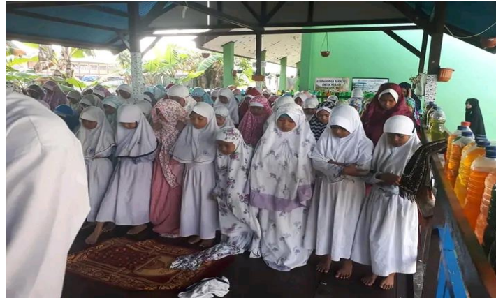
Gambar 5. Sholat dhuhur berjamaah