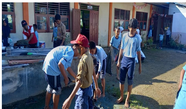
Gambar 4. Gotong royong membersihkan lingkungan sekolah