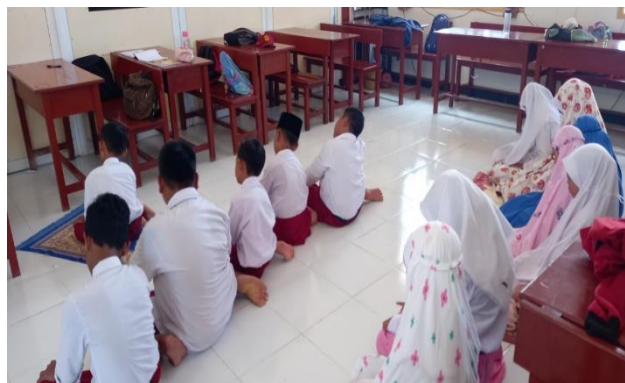
Gambar 3. Sholat dhuha berjamaah

Hasil penelitian menunjukkan benar adanya bahwa di SD Swasta Provinsi Papua Barat Daya menerapkan nilai kerendahan hati. Pada pukul 08.00 peserta didik diharuskan sholat dhuha dan pada saat peserta didik bergegas untuk melaksanakan sholat dhuha peserta didik dengan rendah hati melakukan perintah yang diterapkan oleh sekolah. Pada saat guru menyuruh peserta didik untuk tertib pada saat akan melakukan sholat peserta didik dengan rendah hati melakukannya. Peserta didik tidak keberatan pada saat melakukan kegiatan tersebut guna agar peserta didik terbiasa dalam melakukan dalam kehidupan sehari-hari.