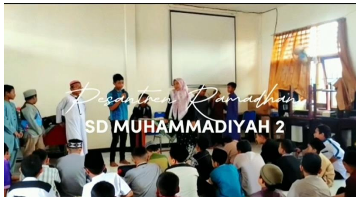
Gambar 6. Pesantren kilat

Hasil penelitian menunjukkan bahwa di SD Swasta Provinsi Papua Barat Daya benar-benar menerapkan nilai living value education toleransi. Hal ini peneliti melihat bagaimana cara peserta didik menanamkan nilai toleransi kepada sesama teman mereka dengan cara tidak saling mengejek teman yang berbeda suku dan ras, serta saling menghormati teman yang berbeda agama. Ada beberapa peserta didik di kelas IV yang belum bisa menghargai perbedaan antar sesama teman, mereka masih saling mengejek temannya, tetapi seiring waktu peneliti melihat bahwa kebanyakan diantara peserta didik tersebut hampir sudah menerapkan nilai toleransi yang ditanamkan di sekolah.