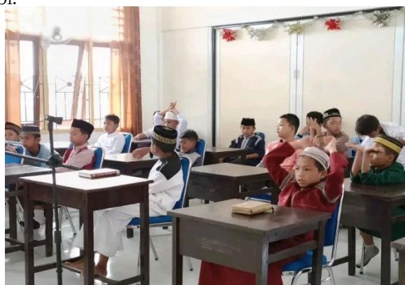
Gambar 1. Kegiatan maulid Nabi

Hasil penelitian yang didapatkan peneliti menunjukkan bahwa benar di SD Swasta Provinsi Papua Barat Daya menerapkan nilai religius melalui kegiatan keagamaan. Kegiatan keagamaan yang dimaksud, yaitu pada saat peserta didik datang ke sekolah dan di saat peserta didik masuk pagar sekolah peserta didik memberi salam kepada guru ,saat tiba dikelas peserta didik sama-sama berdoa sebelum belajar dan seluruh peserta didik melaksanakan sholat dhuha yang dilakukan di gazebo, akan tetapi ada beberapa kelas yang melakukan di dalam kelas dikarenakan kurang luasnya gazebo yang tidak bisa menampung seluruh peserta didik. Peserta didik juga melaksanakan sholat dzuhur sebelum pulang kerumah, peserta didik diwajibkan mengikuti kegiatan pesantren kilat pada saat bulan ramadhan, dan peserta didik diwajibkan mengikuti kegiatan hari besar Islam seperti isra miraj' dan maulid nabi.