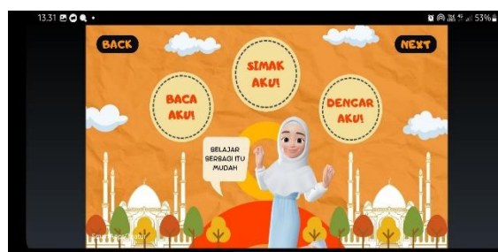
Gambar 3. Tampilan Menu 1 pada Ponsel Pintar

pembelajaran terutama dengan menggunakan media lagu pasti akan meningkatkan minat dan motivasi siswa hal ini dikarenakan anak lebih antusias dalam melihat hal-hal yang berbaur video animasi (Aeni, Aulia, et al., 2022). Adanya musik yang menarik membuat anak makin betah dalam penggunaan aplikasi. Tak luput juga penggunaan kuis, baik kuis lokal di dalam aplikasi, maupun kuis yang tertaut dengan website Quizizz. ZIS Share yang dirangkai satu persatu pada software Smart Apps Creator (SAC) diusahakan menjadi aplikasi yang fleksibel dan siap pakai. Selain dari fleksibilitasnya sebagai aplikasi ponsel pintar, akan tetapi juga fleksibel dengan akses kepada situs-situs penunjang lainnya seperti YouTube dan Spotify. Adapun satu fitur fungsional yang seperti diminta oleh pihak sekolah, yakni cara menghitung zakat.