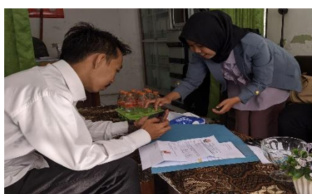
Gambar 6. Proses Uji Coba pada Guru PAI di SD