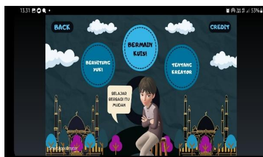
Gambar 4. Tampilan Menu 2 pada Ponsel Pintar

Waktu demi waktu berselang dalam memfiksasi aplikasi ZIS Share, aplikasi pun siap untuk digunakan. Pengujian aplikasi dilakukan dengan memberi kesempatan kepada Bapak Yughni untuk menggunakannya. Setelahnya kami juga mempresentasikan aplikasi tersebut di depan para peserta didik kelas 6 SD Negeri Panyingkiran 2. Aplikasi ZIS Share mengakomodasi semua yang direncanakan di awal, hal ini menjadi sebuah catatan baik untuk peneliti. Selanjutnya peneliti melakukan angket baik itu kepada pendidik maupun peserta didik.