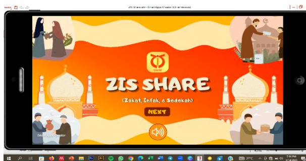
Gambar 7. Preview Tampilan Aplikasi ZIS Share pada Software Smart Apps Creator

Permendikbud menganjurkan bahwa salah satu prinsip pembelajaran harus menekankan penggunaan teknologi untuk meningkatkan efektivitas dan efisiensi pembelajaran di dunia Pendidikan (Fadhila Tunissa et al., n.d.). Upaya pembuatan aplikasi ZIS Share sejalan dengan hal tersebut. ZIS Share membukakan akses pembelajaran yang dapat dilakukan di luar jam belajar sekolah. Tiap anak bisa menggunakannya di rumah, selepas bermain dengan teman, bahkan sebelum tidur. Aplikasi ZIS Share mengakomodasi anak-anak dengan gaya belajar audio, visual, maupun audiovisual, serta ditambah dengan permainan berupa kuis. Hal ini mengupayakan agar anak-anak betah berlama-lama menggunakan ZIS Share, terlebih lagi dibawa dengan suasana yang menarik. ZIS Share membantu guru PAI di SD untuk menyukseskan tujuan pembelajaran pada kurikulum.