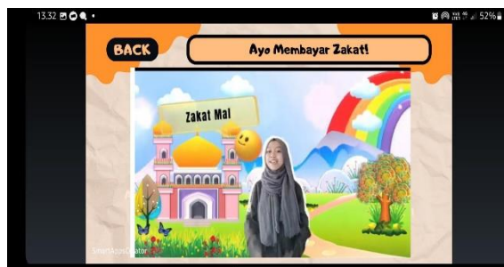
Gambar 5 Tampilan Pemutaran Konten