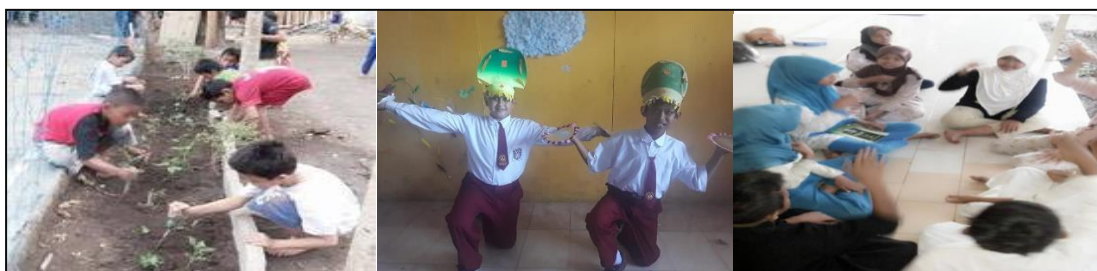
Gambar 4. Kegiatan ekstrakurikuler

Sedangkan untuk strategi pengelolaan sumber daya, peserta didik diteraksikan dengan lingkungan yang ada di sekolah ataupun di asrama. Peserta didik didorong untuk berani menyatakan permintaan bantuan kepada teman, guru ataupun orangtua ketika menghadapi kesulitan dan membutuhkan pertolongan. Ketidakmampuan menghadapi situasi seperti ini akan membuat peserta didik depresi, dan jika situasi tersebut terus berlanjut maka kondisi peserta didik akan bertambah buruk yang pada gilirannya akan berdampak pada kegagalan pembelajaran (Barseli dkk., 2017). Dengan demikian, interaksi dengan teman sebagai tutorial sebaya, atau memanfaatkan guru asrama guna mengatasi masalah pembelajaran dapat terlaksana, termasuk kegiatan bersih-bersih rutin yang dilaksanakan oleh peserta didik baik untuk tempat tidur, tempat belajar, tempat bermain dan sebagainya.