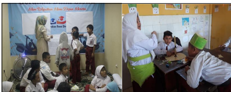
Gambar 2. Kegiatan pembelajaran sesuai gaya belajar peserta didik

Pengembangan kemampuan SRL peserta didik yang dilakukan di sekolah lebih banyak diterjadikan pada proses pembelajaran di kelas dan luar kelas. Hal ini sudah disusun dan tercantum dalam perencanaan pembelajaran oleh guru (Baihaki, 2020; Syafei dkk., 2022) sebagai prosedur utama dalam pengelolaan pembelajaran. Salah satu kegiatan yang mengarah pada strategi kognitif adalah ketika guru menghadirkan stimulan berupa pertanyaan-pertanyaan di seputar objek yang ingin dipelajari guna memancing peserta didik untuk merespon yang ditanyakan guru. Biasanya guru melontarkan pertanyaan yang berhubungan dengan aktivitas peserta didik sehari-hari (de Wet, 2017) dengan demikian akan merangsang peserta didik untuk mengeksplorasi pemahamannya terhadap objek yang ditanyakan (Arani, 2022; Hmelo-Silver, 2004). Cara lain yang digunakan oleh guru adalah dengan kuiz tebak benda, tebak kata dan sebagainya, yang intinya memancing rasa keingintahuan peserta didik atas yang ingin diajarkan oleh guru (Susiani, 2021). Dalam ilmu metodologi pembelajaran, cara seperti ini digolongkan sebagai langkah apersepsi (Agustin, 2011; Ardiana, 2022), atau dalam istilah yang berbeda, Chatib (2015) menyebutnya sebagai scene setting .