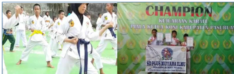
Gambar 3. Kegiatan ekstrakurikuler

kemampuan peserta didik, sehingga memantik untuk terbentuknya karakter tanggung jawab dan cinta terhadap lingkungan (Yahya, 2019).