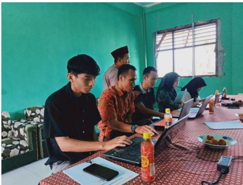
Gambar 3 tim pengabdian membimbing peserta praktek

Tim pengabdian mengawasi dan membimbing setiap guru dalam praktek pembuatan soal online sampai selesai. Pada tahap ini peserta sangat antusias untuk mempraktekkan pembuatan soal online menggunakan aplikasi quizizz .