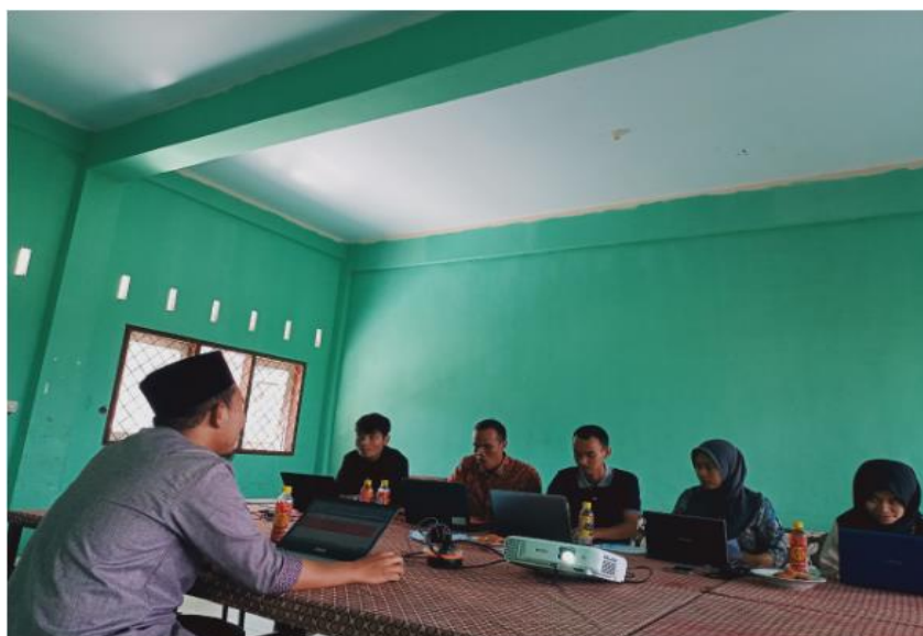
Gambar 2 pemberian materi oleh tim pengabdian

Guru-guru memilih mata pelajaran yang diampu kemudian mulai berlatih membuat soal online dengan menggunakan aplikasi quizizz .