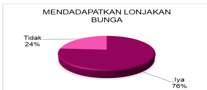
Gambar 7 Mengalami Lonjakan Bunga Pada Tunggakan

memiliki sejumlah uang mereka masih bisa melakukan transaksi ataupun pembelian sesuai apa yang diinginkan. Pada penggunaan pay later ini memudahkan dalam proses pembayaran dan transaksi pembelian. Selain itu responden juga mengemukakan masalah kebutuhan dapat teratasi tetapi akan muncul masalah baru yaitu tunggakan. Merujuk pada hal tersebut beberapa konsumen bahkan pernah mengalami tunggakan pada paylater ini. Tunggakan ini berpengaruh pada besaran bunga yang diberikan oleh pay later. Salah satunya pada shopee paylater memberikan bunga sebesar 2,95%. Dibuktikan pada pemaparan dari e-commerce shopee untuk berbelanja di platform Shopee dengan suku bunga 0% - 2,95%. Pengajuan Shopee pay Later hanya membutuhkan KTP dan foto diri saja (Shopee, 2018). Sehingga pada gambar 7 menyatakan pernah mengalami lonjakan bunga pada tunggakan yang mereka dapatkan, sebagai berikut :