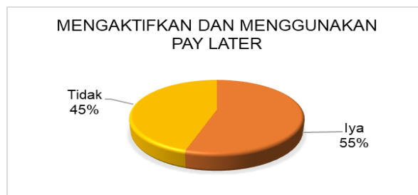
Gambar 4 Penggunaan dan Pengaktifan Pay Later

Dari gambar 3 di atas pay later disediakan untuk memfasilitasi transaksi agar konsumen lebih mudah serta menarik perhatian para pelaku belanja online dengan memberikan slogan “Belanja sekarang bayar Nanti”. Sistem paylater memiliki fungsi yang mirip dengan kartu kredit memungkinkan para konsumen membeli produk atau layanan tanpa membayarnya secara langsung dapat juga dilakukan melalui cicilan. Hal ini yang membentuk pengguna tertarik untuk mengaktifkan fitur pay later didukung hasil survei pada gambar 4 dan 5, sebagai berikut :