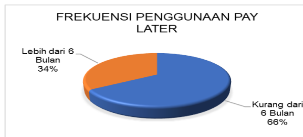
Gambar 5. Jangka Penggunaan Pay Later

Pada gambar 4 membuktikan sebanyak 55% responden mengaktifkan sistem pay later dan menggunakannya dalam transaksi belanja mereka. Hal ini memberikan keyakinan pada pengguna untuk menggunakan pay later dibuktikan pada jangka penggunaan gambar 5, responden menyatakan 34% menggunakan pay later lebih dari 6 bulan. Maka dengan jangka yang relatif lama tersebut penggunaan pay later sudah menjadi hal yang berkepanjangan. Studi mengemukakan para konsumen yakin dengan konsep dan sistem pay later yakni buy now, pay later dapat memenuhi kebutuhannya disaat ingin berbelanja dengan barang sudah sampai dan pembayaran dibulan berikutnya. Faktor-faktor itulah konsumen ingin menggunakan paylater di setiap berbelanja dalam jangka panjang (Eria & Hardhika, 2021). Tentunya dari persentase penggunaan pay later ini ada kelebihan yang dinyatakan oleh para konsumen dipaparkan pada gambar 6 berikut :