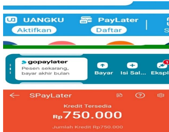
Gambar 3 Pay Later di E-commerce

konsumennya dapat membayarnya dengan cara mencicil mulai dari 1 hingga 12 bulan(Putra, 2021). Pada pay later biasanya ada limit kredit yang diberikan oleh e-commerce sebagai sarana pembayaran sementara ketika konsumen membeli barang. Berikut gambar beberapa e-commerce yang mengaktifkan sistem pay later, sebagai berikut: